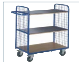
Antirutschbelag für Etagenwagen und Hub- und Hebegeräte