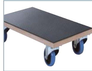
Flexibler Rutschschutz auf Transportrollern und Rollwagen