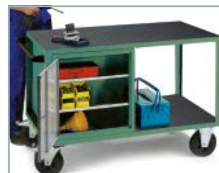
Schützende Rollwagen- und Werkzeugwagenauflage