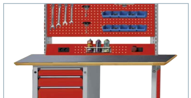
Dauerhafte Werkbank- und Arbeitsplatzauflage, Bodenbelag